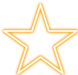
Painel luminoso bidimensional no formato estrela 5 pontas