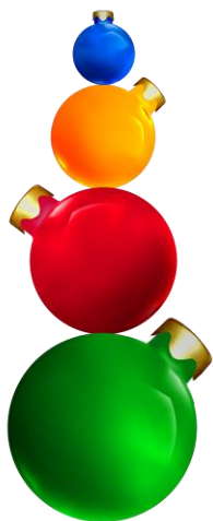
Totem composto por 4 bolas natalinas