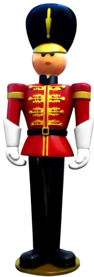
Soldado de chumbo com cores predominantes vermelho e preto