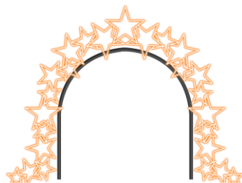
Arco luminoso bidimensional com estrelas