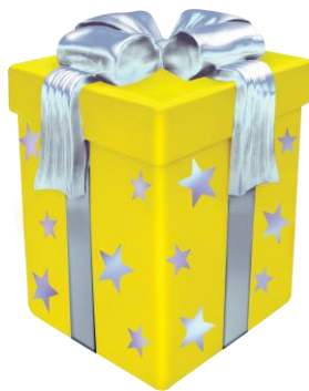
Caixa de presente amarela