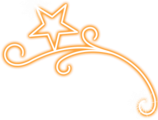
Painel luminoso bidimensional em forma de estrela