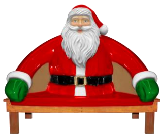
Banco com encosto na forma de papai Noel