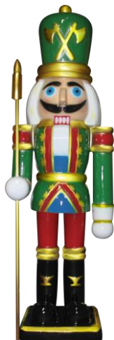
Quebra Nozes segurando machado