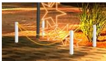
Estaca de madeira para isolamento com cordão dourado