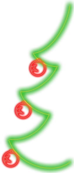
Painel luminoso com desenho em forma de pinheirinho