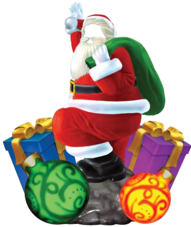
Painel com cenário decorativo para fotos