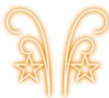
Arabesco duplo com estrelas