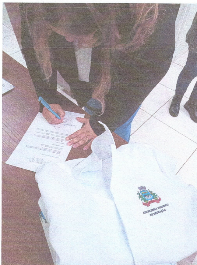
Comprovação do recebimento