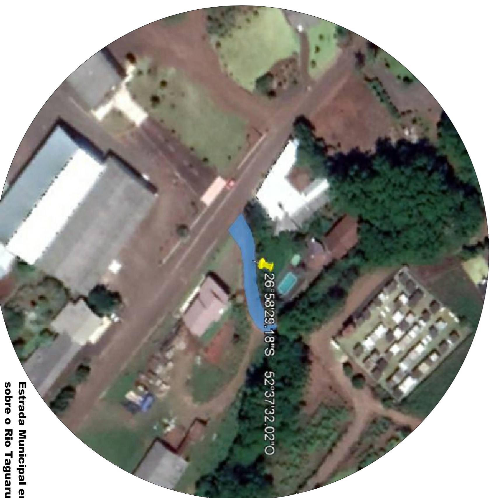
Estrada Municipal entre a EMCA-005 e passagem sobre o Rio Taguarussu - Linha Bento