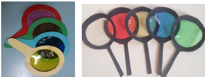
IMAGEM DA LUPA:

IMAGENS DISPONÍVEIS EM: https://br.pinterest.com/pin/848506386023809728/