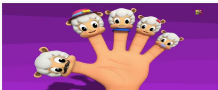
Ovelhas Dedo Família | berçário Rima | Kids Song | Preschool Poetry | Sheeps Finger Family

EXPLORANDO MOVIMENTOS COM AS MÃOS E CORPO DA CRIANÇA, CONFORME RITMO MUSICAL.