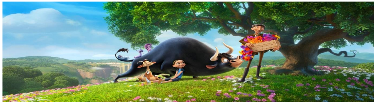
IMAGEM DISPONÍVEL EM: https://bebe.abril.com.br/familia/o-touro-ferdinando-filme/ ACESSO EM 27/04/21

FERDINANDO É O PERSONAGEM PRINCIPAL DO FILME: “O TOURO FERDINANDO”. ELE É UM TOURO COM UM TEMPERAMENTO CALMO E TRANQUILO, QUE PREFERE SENTAR-SE EMBAIXO DE UMA ÁRVORE, RESPIRAR UM AR PURO, CHEIRAR AS FLORES DO CAMPO E RELAXAR AO INVÉS DE CORRER POR AÍ BUFANDO E BATENDO CABEÇA COM OS OUTROS. A MEDIDA QUE VAI CRESCENDO, ELE SE TORNA FORTE E GRANDE, MAS COM O MESMO PENSAMENTO. QUANDO CINCO HOMENS VÃO ATÉ SUA FAZENDA PARA ESCOLHER O MELHOR ANIMAL PARA TOURADAS EM MADRI, FERDINANDO É SELECIONADO ACIDENTALMENTE... MAS NADA MUDA O TEMPERAMENTO E AS PREFERÊNCIAS DO TOURO FERDINANDO.