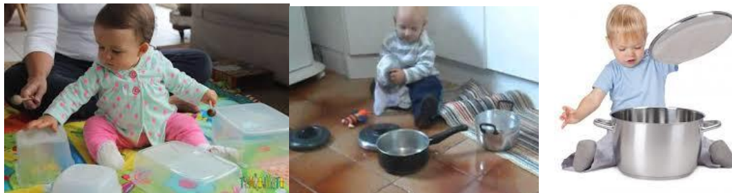
IMAGENS RETIRADAS DA INTERNET.

DEPOIS, PODE SER EM OUTRO MOMENTO (DIA) ENCAIXE AS TAMPAS NAS PANELAS E RETIRE. OBSERVE SE O BEBÊ BRINCARÁ DE ENCAIXAR TAMBÉM. PODE COLOCAR TAMPAS DE TAMANHOS DIFERENTES DAS PANELAS E OBSERVAR A REAÇÃO DOS BEBÊS. EM SEGUIDA COLOCAR BRINQUEDOS OU OBJETOS NA PANELA. QUANDO ABRIR A TAMPA, ENCONTRARÁ UMA SURPRESA. PARA OS BEBÊS MENORES, PODEM TROCAR AS PANELAS, POR POTES PLÁSTICOS OU OUTRO OBJETO QUE ESTEJA DÍSPONÍVEL EM CASA.