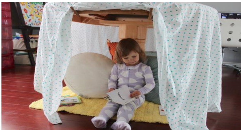
MODELO DE CABANA

-NÃO SE ESQUEÇAM DE REGISTRAR ESTES MOMENTOS MARAVILHOSOS E COMPARTILHAR NO GRUPO, SE PREFERIR PODEM FAZER UM DESENHO DESTE MOMENTO MÁGICO.