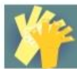
PALMA COM PALMA