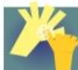
DEDO E UNHAS