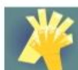
PARTE SUPERIOR DA MÃO