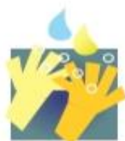
ÁGUA + SABÃO