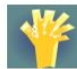
ENTRE OS DEDOS