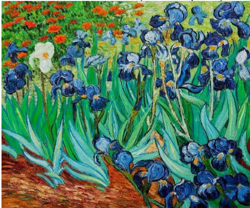
"Íris" - Vincent Van Gogh- (1853-1890)

"Sejamos como a primavera que renasce cada dia mais bela. Exatamente porque nunca são as mesmas flores." (Clarice Lispector)