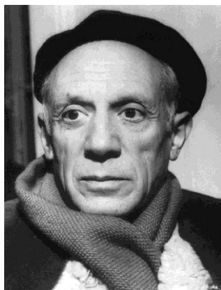
Imagem 3 Pablo Picasso