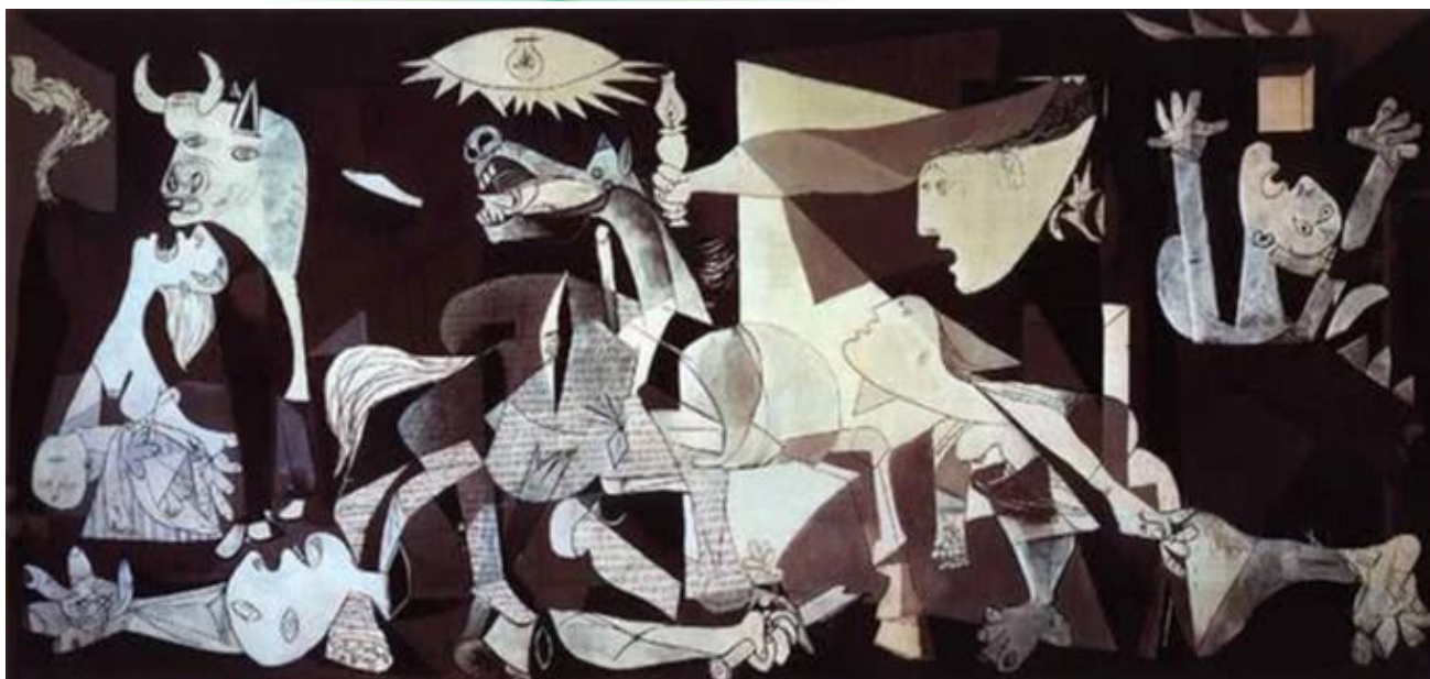
Figura 2 Guernica Pablo Picasso (imagem da internet)

Nas figuras presentes, podemos notar o desespero e os gritos de horror. No chão, há um soldado morto e ao seu lado uma mulher com uma perna ferida.