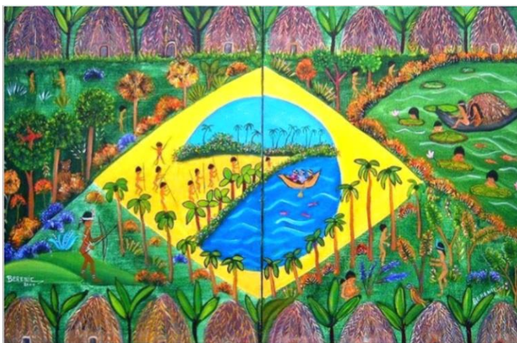
Obra Brasilíndio, Berenic. 2003

D. Pedro tornou-se o primeiro imperador do Brasil, com o título de D. Pedro I. O Brasil passou a ser uma monarquia, uma forma de governo em que os poderes são exercidos pelo imperador ou rei.