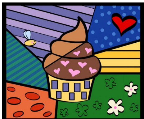
ARTISTA: ROMERO BRITTO. OBRA: CUPCAKE

AS VELAS DO BOLO DO MEU ANIVERSÁRIO ERAM COLORIDAS.