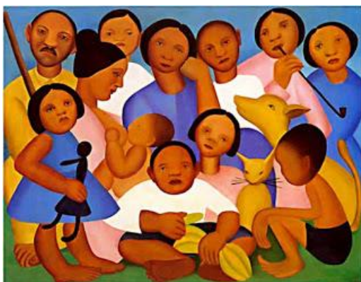
ARTISTA: TARSILA DO AMARAL. OBRA: FAMÍLIA