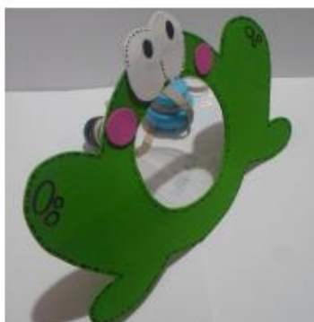
BILBOQUÊ DE ROLINHO DE GARRAFA PET

EXEMPLOS DE COMO CONFECCIONAR SEU BILBOQUÊ: