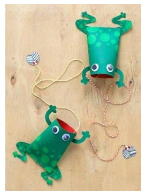
BILBOQUÊ DE ROLINHO DE PAPEL HIGIÊNICO